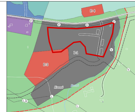
Skýringarmynd: Hluti Aðalskipulags Grundarfjarðarbæjar 2019-2039