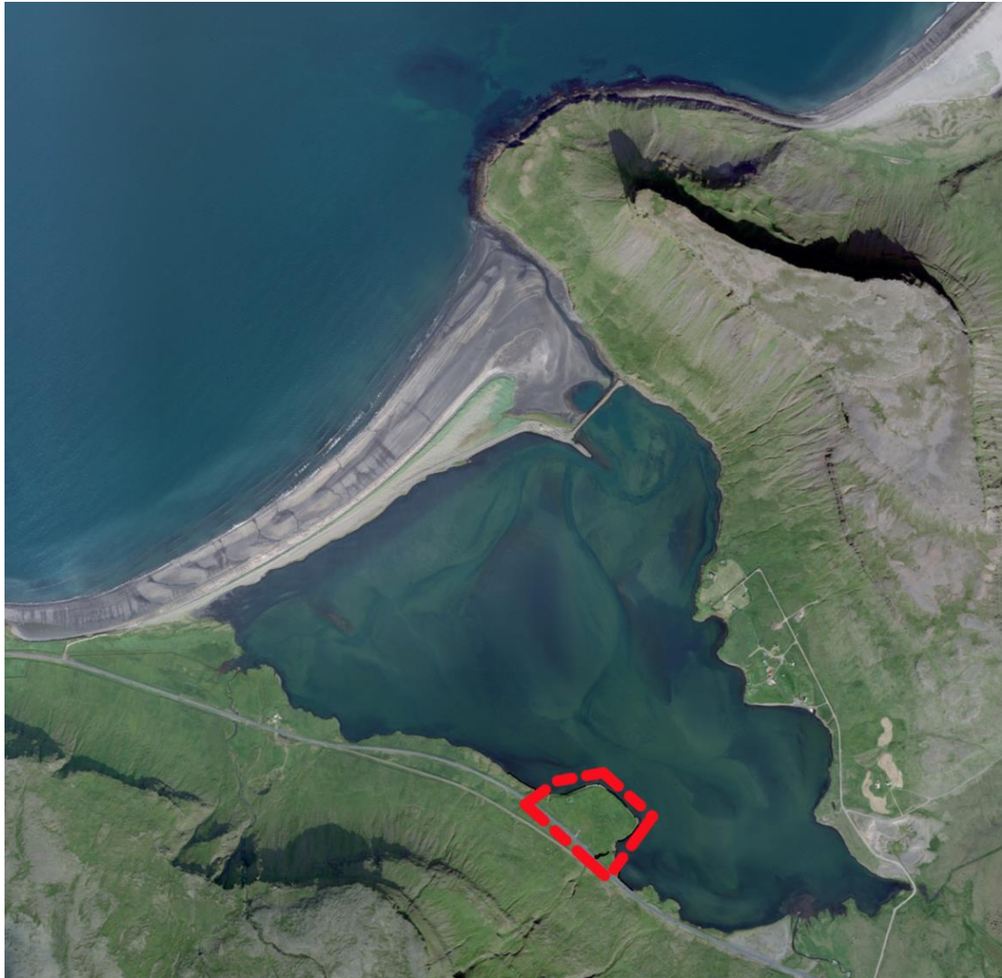
Fyrirhugað skipulagssvæði er afmarkað með rauðri brotlínu á loftmynd sem sýnir Lárvaðal og næsta nágrenni.