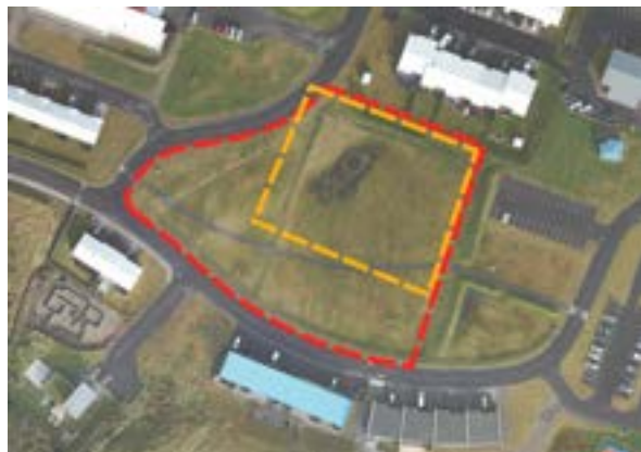
Austurvöllur og Paimpolgarðurinn

Við endurskoðun deiliskipulagsins er gert ráð fyrir að nýjar íbúðir verði á hluta opna svæðsins. Á móti þeirri breytingu er í staðinn gert ráð fyrir að stækka samfélagsreitinn sem þessu nemur, sunnan við núverandi skóla og íþróttahús. Þannig skapast gott tækifæri til frekari þróunar skóla og íþróttastarfssemi á samfelldu svæði austan við Borgarbraut.