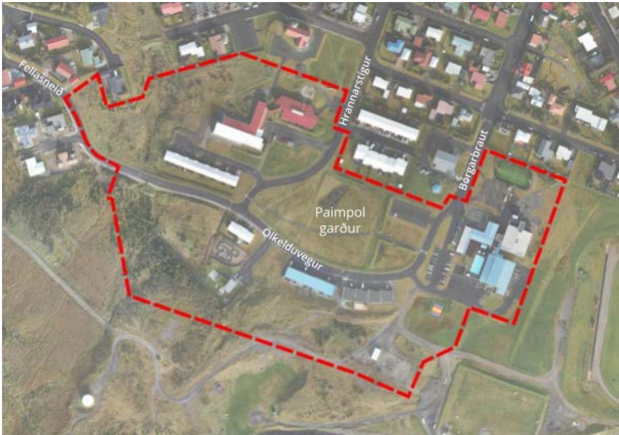
Mynd 1: Mörk gildandi deiliskipulags fyrir Ölkeldudal.

Lýsing þessi er sameiginleg fyrir endurskoðun á deiliskipulagi og breytingu á aðalskipulagi.