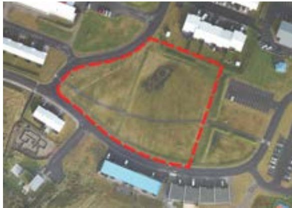
Mörk Paimpolgarðsins skv. aðalskipulagi

Í aðalskipulagi er Paimpolgarðurinn á opnu svæði (OP-3) og er um 9.000 m 2 að stærð, en til samanburðar má nefna að Austurvöllur er um 4.000 m 2 að stærð, fótboltavöllur í fullri stærð er um 4.000 m 2 og Þríhyrningurinn í Grundarfirði er um 2.500 m 2 .