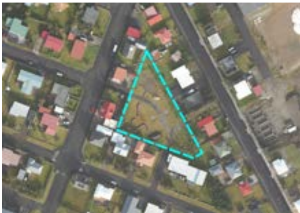
Þríhyrningurinn í Grundarfirði