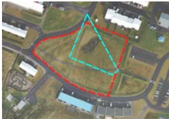
Þríhyrningurinn í Grundarfirði og Paimpolgarðurinn