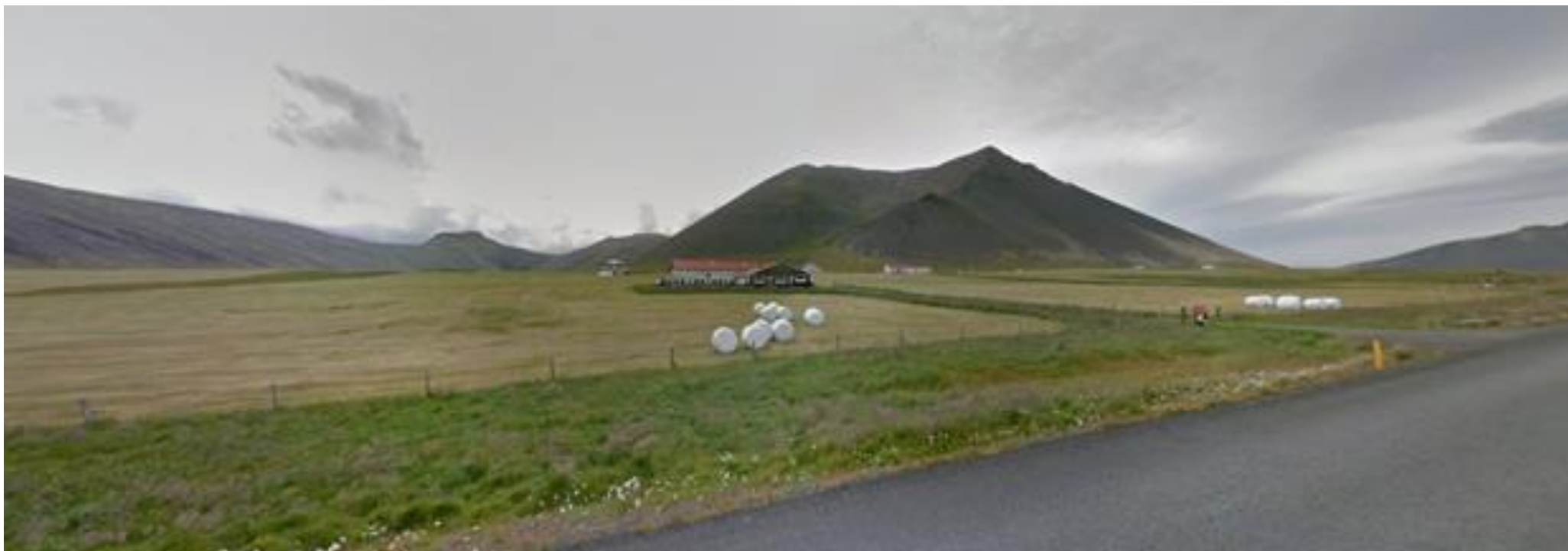
Mynd 1.1 Séð heim að Berserkseyri frá Þjóðvegi. Í gildandi skipulagi er gert ráð fyrir frístundahúsum austan við bæjarhúsin (til vinstri) en í breyttu skipulagi er gert ráð fyrir að þau verði vestan við húsin (til hægri) og undir hlíðum fjallsins Kolgrafamúla.