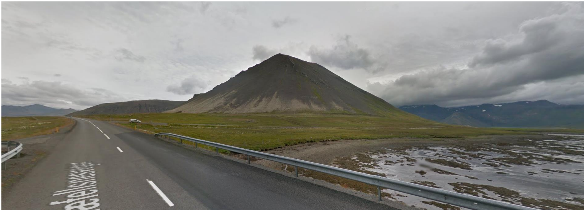
Mynd 1.2 Séð að skipulagssvæðinu frá brúnni yfir Kolgrafafjörð. Bíllinn á myndinni er á heimreiðinni að Kolgröfum en skipulagssvæðið er ofan hennar. Fjallið ofan svæðisins heitir Kolgrafamúli. Bæjarhúsin á Berserkseyri eru í hvarfi vinstra megin við múlann og bæjarhúsin á Kolgröfum, sem einnig eru í hvarfi, eru til hægri við múlann.