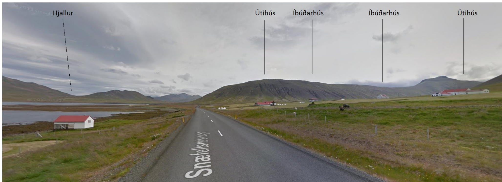
Mynd 1.3 Byggingar á Berserkseyri. Gamall hjallur er neðan þjóðvegur. Bæjarhúsin á Berserkseyri eru ofan þjóðvegur og bæjarhúsin á Berserkseyri Ytri 2 eru lengst til hægri á myndinni.