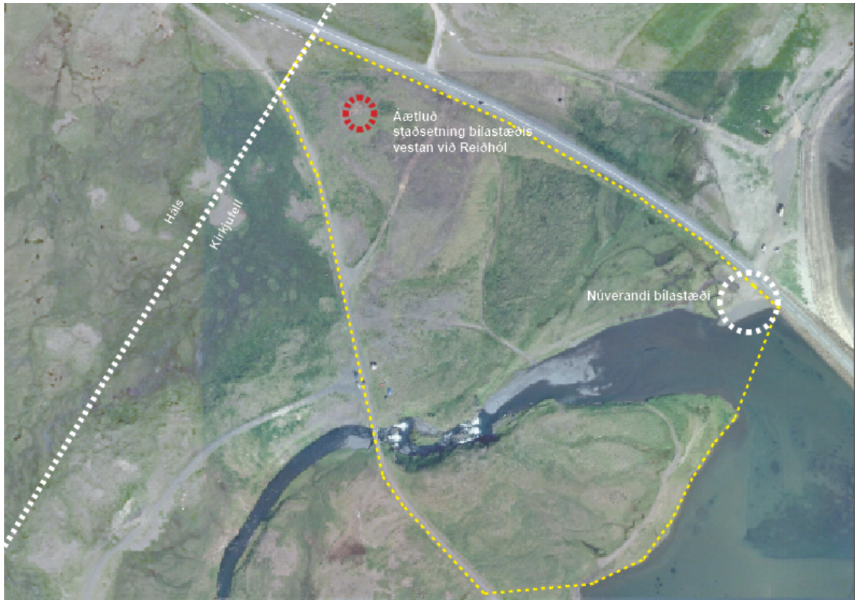
Mynd 5. Afmörkun deiliskipulagssvæðisins. Myndin er ekki í kvarða.

Afmörkun deiliskipulagssvæðisins er sýnd á mynd 5 með gulri brotalínu. Innan deiliskipulagssvæðis verða bílastæði, gönguleiðir, upplýsingaskilti og áningarstaðir. Hvít brotalína sýnir landamerki milli Kirkjufells og Háls. Flatarmál deiliskipulagssvæðisins mælist um 9 ha. Áætluð staðsetning nýs bílastæðis vestan við Reiðhól er merkt inn með rauðum hring og núverandi bílastæði með hvítum hring.