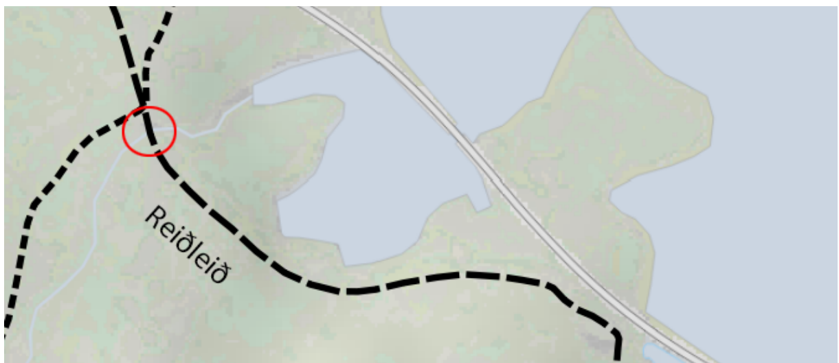
Mynd 3. Reiðleið skv. gildandi aðalskipulagi. Staðsetning Kirkjufellsfoss er merkt inn með rauðum hring.

Gamall þjóðvegur, sem nú er merkt sem reiðleið, í aðalskipulagi Grundarfjarðarbæjar liggur í gegnum Kirkjufellslandið, yfir gamla brú yfir Kirkjufellsfoss áleiðis að þéttbýlinu í Grundarfirði (mynd 3).