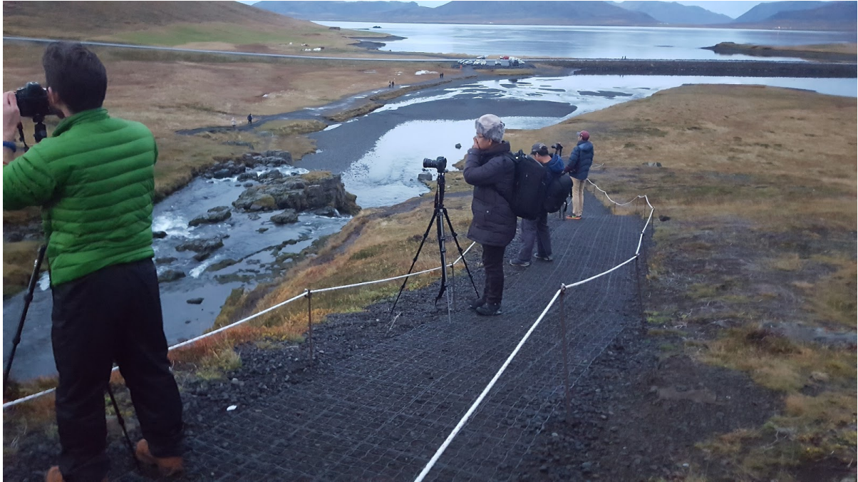
Mynd 2. Ljósmyndarar mynda Kirkjufellsfoss

vinsæll viðkomustaður að vetri til. Bílastæðið annar ekki þessum mikla fjölda og leggja ökumenn því í vegköntum beggja vegna vegarins með tilheyrandi umferðaröngþveiti og slyshættu.