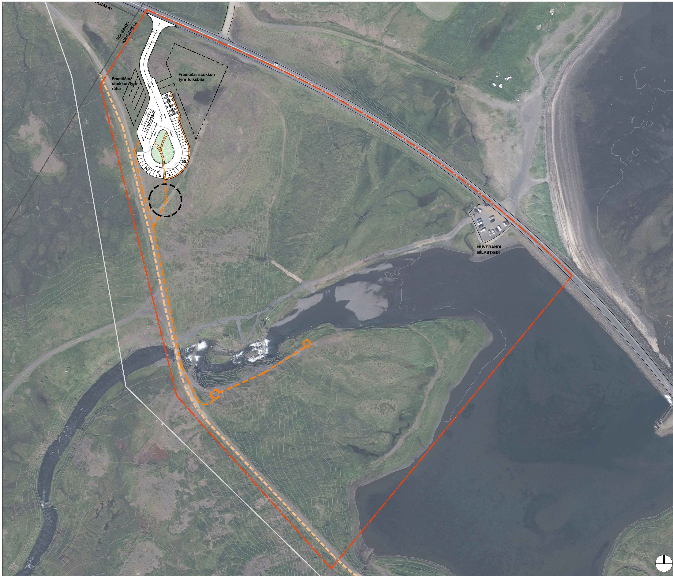
Tillaga að deiliskipulagi Kirkjufellsfoss í mkv. 1:2000

Kirkjufellsfoss. Tillaga að deiliskipulagi.