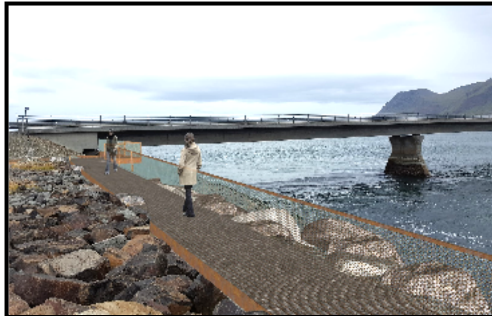
Mynd 6: Þrívíddarmynd sem sýnir mögulega útfærslu útsýnispalls með gangvegi undir brúna

steypa eða timbur. Á hvorum enda útsýnispalls er heimilt að reisa vegg, skýli eða skjól, að hámarki 2,6 m á hæð til norðurljósa- og náttúruskoðunar. Heimilt er að setja útskot á útsýnispall sem auka gæði upplifunar.