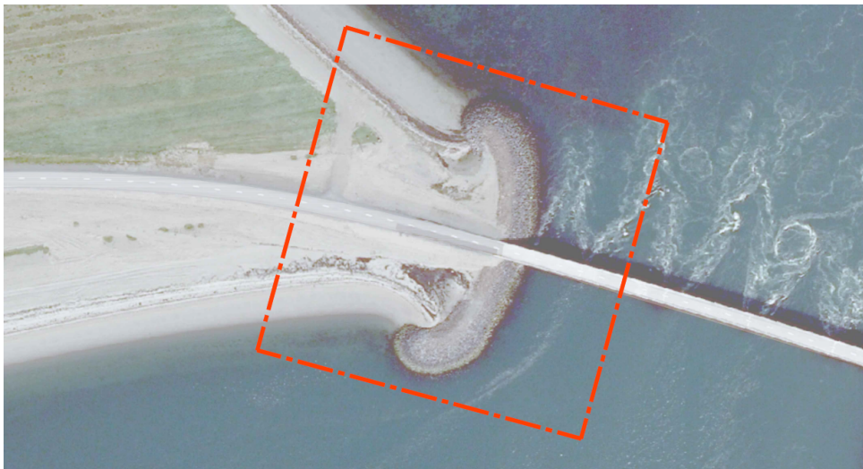
Mynd 5: Mörk deiliskipulagssvæðis (ekki í kvarða)

Deiliskipulagssvæðið nær utan um vesturluta brúarinnar yfir Kolgrafafjörð, fjörunar við brúna og grjóthleðslur. Svæðið er um 3,3 ha að stærð.