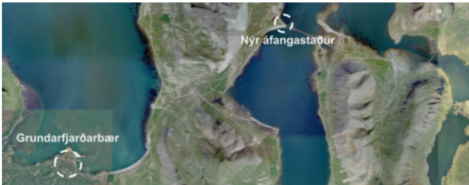
Mynd 3: Nýr áfangastaður er í u.þ.b. 9 km fjarlægð frá þéttbýlinu í Grundarfirði.

Í verkefninu felst að útbúa aðstöðu til að njóta útsýnis og náttúruhlífis við vesturenda brúarinnar yfir Kolgrafafjörð ásamt nýjum bílastæðum og svæði til áningar. Gert er ráð fyrir bílastæðum fyrir allt að tvær rútur og 11 fólksbíla, þar af eitt fyrir hreyfihamlaða, ásamt hjólastæðum. Á áfangastað verður gert ráð fyrir salernisaðstöðu, nestisaðstöðu og útsýnispall ásamt upplýsingaskiltum um nánasta umhverfi, náttúru og nærliggjandi þjónustu.