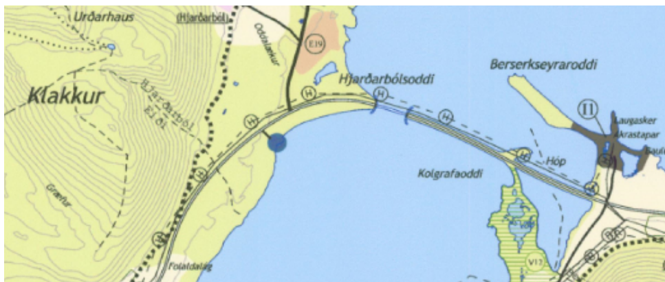
Mynd 4: Hluti úr Aðalskipulagi Grundarfjarðar 2003-2015, dreifbýlishluta

Í Svæðisskipulagi Snæfellsness, sem samþykkt var árið 2014, var m.a. mörkuð stefna um nýtingu auðlinda og um umgengni þeirra, til nánari útfærslu í aðalskipulagi einstakra sveitarfélaga. Eitt af markmiðum í kafla um búsetuskilyrði og atvinnulíf er að landbúnaður, ferðaþjónusta og útivist verði ráðandi landnýting í dreifbýli.