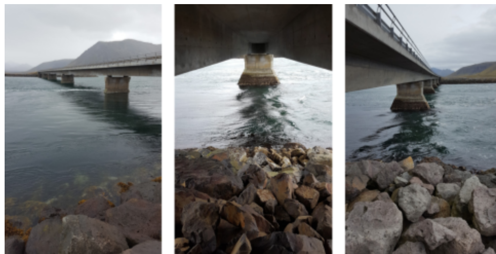
Mynd 2: Á grjótnargardönni undir brúnni yfir Kolgrafafjörð

Árið 2003 var lokið við þverun Kolgrafafjarðar með vegfyllingu og um 210 m langri brú. Fyrir 1-2 árum var aðstaða fyrir ferðalanga bætt, vestanvert við brúna, þar sem vinsælt var orðið að stöðva bíla og njóta náttúru og útsýnis. Tæpum 100 m frá vesturenda brúarinnar er beygt niður vegspotta í nokkrum halla, niður á ca. 1500 m 2 malarplan norðan megin vegar, þar sem hægt er að leggja bílum og ganga út á grjótnargardö umhverfis brúarsporðinn. Mölin á planinu er mjög gróf og hafa bílar og rútur fest sig í mölinni. Eitt nestisborð er við grjótnargardönn, en engin lýsing eða önnur aðstaða er á svæðinu. Mögulegt er að fara undir brúna eftir grjótnargardönnum. Leiðin er ekki greiðfær þar sem bíl frá grjótnargardönni undir brúarkantinn er ekki hátt, en undir brúargólfinu sjálfu er manngengt.