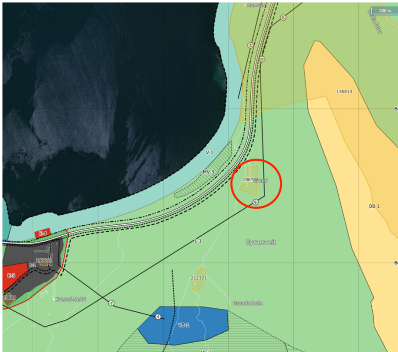
Mynd 3: Skjáskot úr Aðalskipulagi Grundarfjarðar 2019-2039 sem sýnir staðsetningu svæðisins o.fl.

Í skipulagsgerðinni er stefnt að breytingu á Aðalskipulagi Grundarfjarðar 2019-2039. Í megindráttum felst breytingin í afmörkun skipulagssvæðisins ásamt breytingu á landnotkun úr landbúnaði í verslun og þjónustu og grófum skipulagsskilmálum fyrir nýtt gistiheimili, þjónustubyggingu og aðra ferðatengda þjónustu.