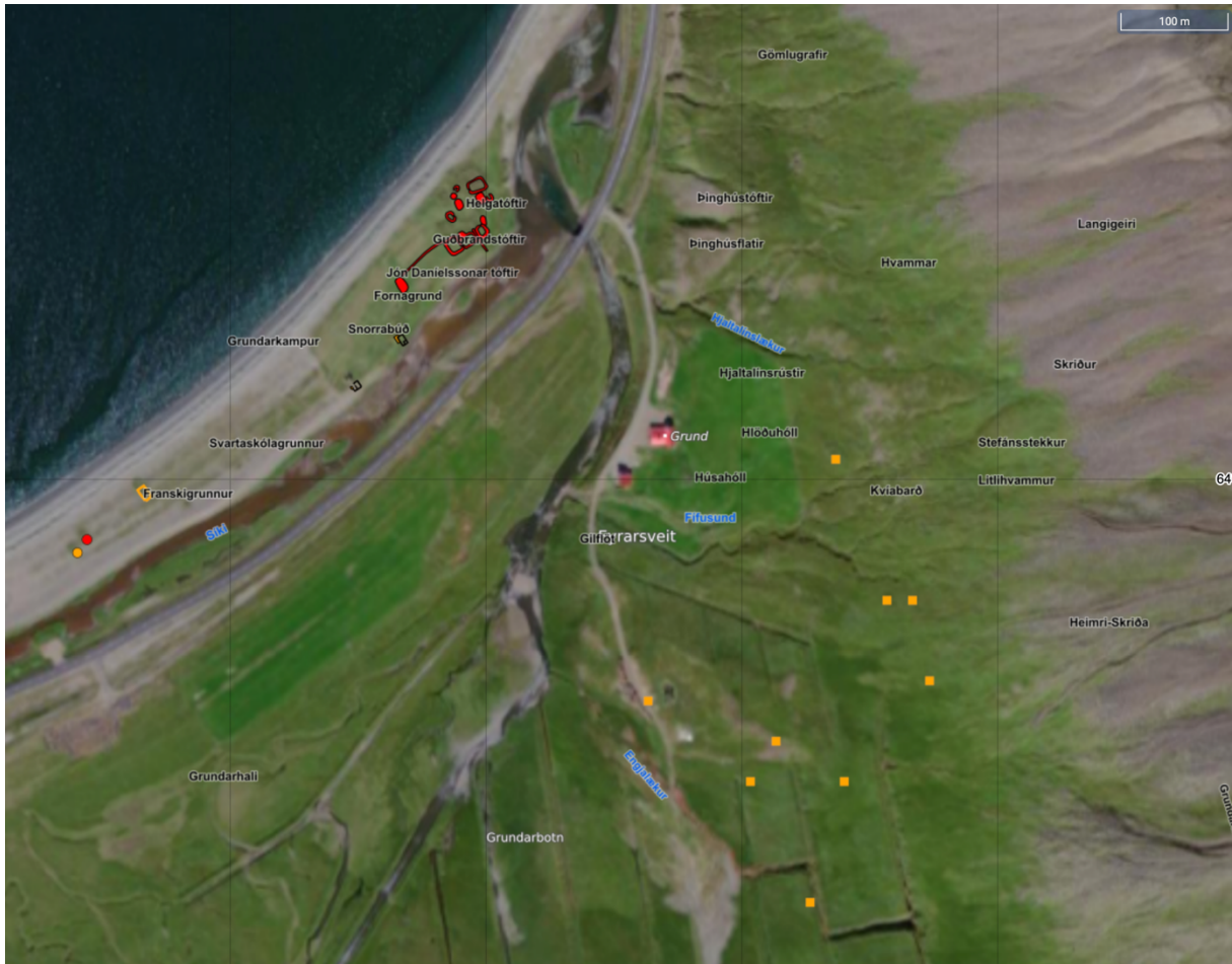
Mynd 1: staðsetning, örnefni, menningarminjar (gulir ferningar)

Samtals er skipulagssvæðið (rauð-skástrikað á mynd hér að neðan) er tæplega 5,6 ha að stærð samsett úr rúmlega 17.000 m 2 lóð Grundar 2 (L-196084) og rúmlega 38.000 m 2 úr landi Grundar (L-136606). Fyrir liggur undirritað samkomulag landeiganda Grundar um nýtingu hluta jarðarinnar í skipulagi þessu. Aðkomuleið er frá stofnvegi 54 - Snæfellsnesvegi.